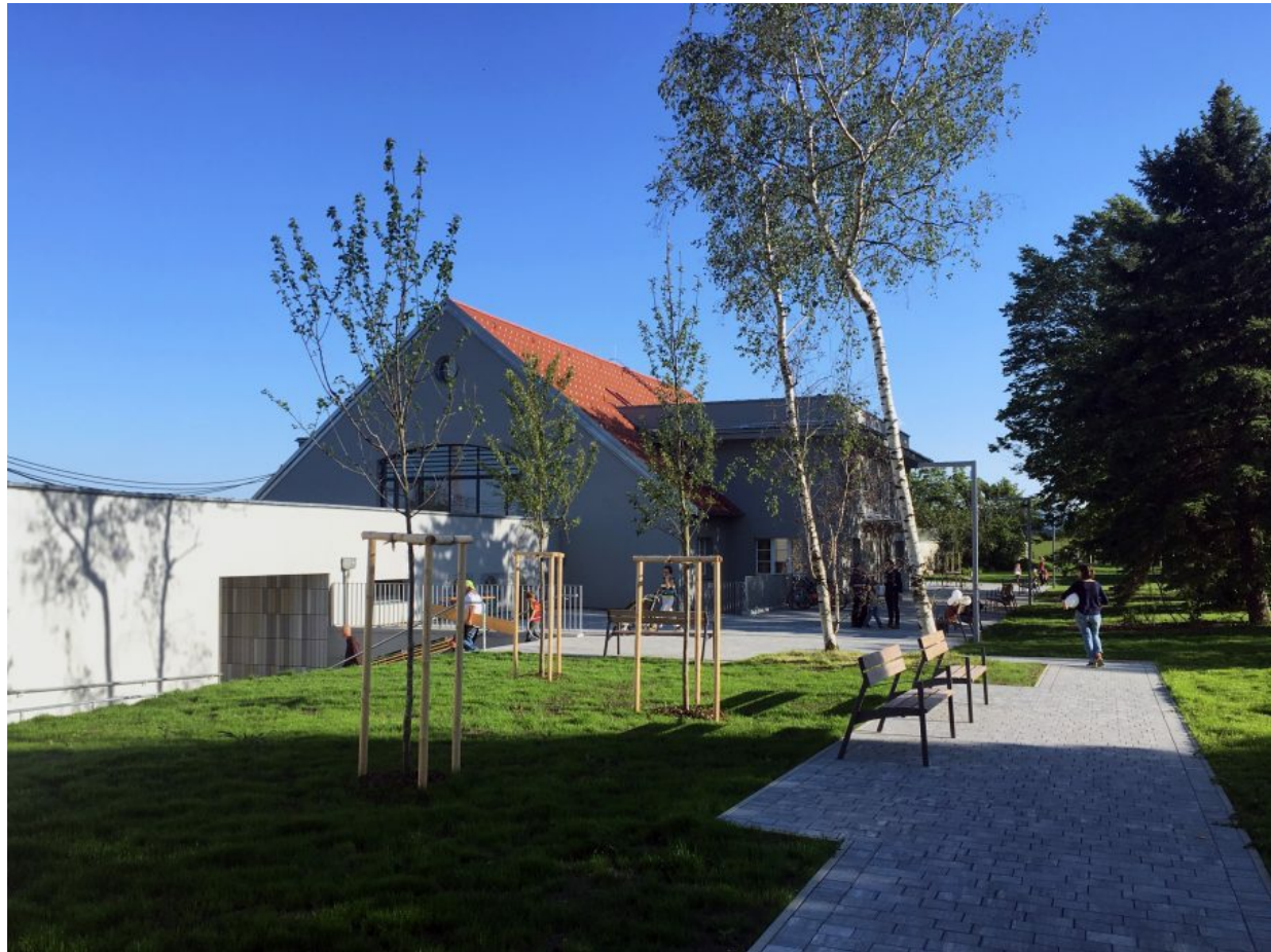
Das Wildgartenhaus am Tag der offenen Tür