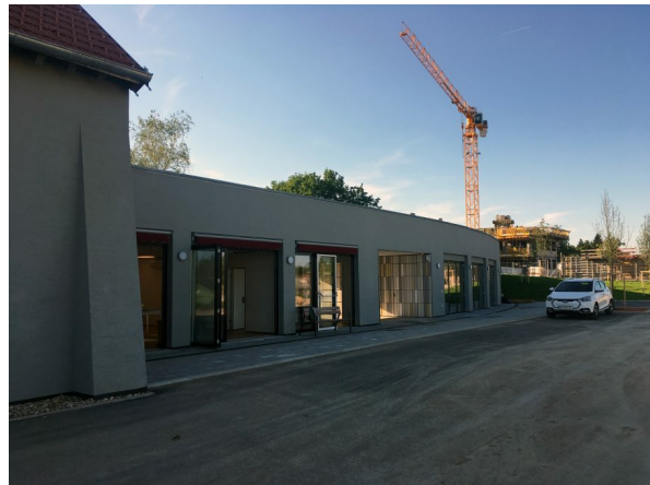
Das Nachbarschaftszentrum