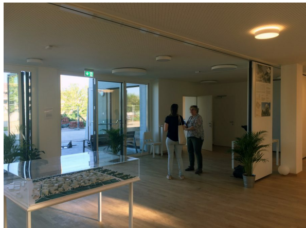
Nachbarschaftszentrum, Mehrzweckraum