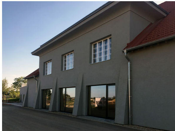
Das Wildgartenhaus / Kindergarten / © raum & kommunikation